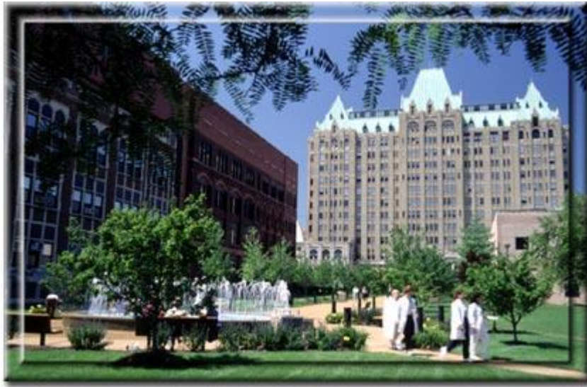
Saint Louis University

پیلەکه وهک له وینهکهی سه رهوه دیاره له دهستی کچهکه دایه به لام نه وان له هه ولی نه وه دان بچوکتیری بکه نه وه چونکه نه مه قه بارهیهکی گه وره ی هه یه.